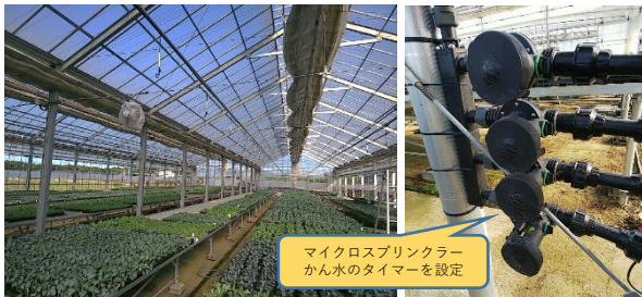
マイクロスプリンクラー かん水のタイマーを設定