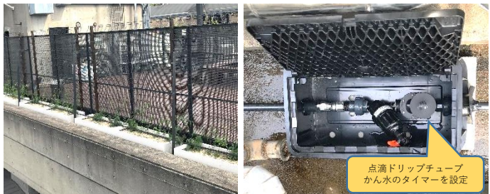
点滴ドリッピングチューブ かん水のタイマーを設定

当初制御盤の使用を考えておられましたが、問題無く使えるとのことをお声を載っています。