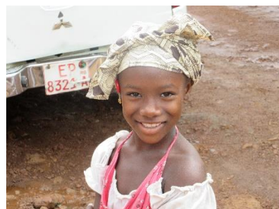
2017年に当社が受注し、 配管敷設工事を行った ギニアで出会った女の子

近年、全世界で「きれいで安全な水」の需要が高まっています。 すべての人が健康に過ごし、「笑顔」でいられるように、 私たちは、世界に「水」のネットワークを広げてまいります。